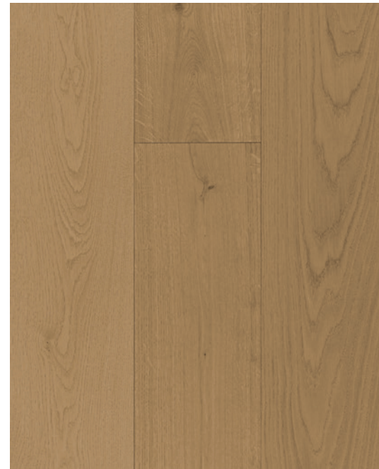
ESSENCE Chêne blanc COULEUR Starlight