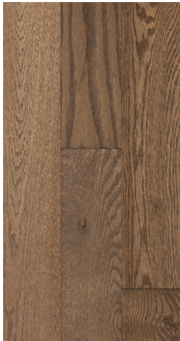
ESSENCE Chêne rouge COULEUR Concrete Grey