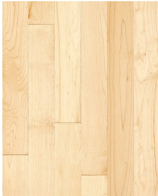
ESSENCE Érable COULEUR Naturel