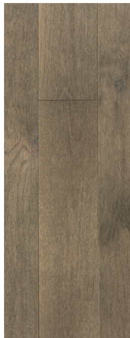
ESSENCE Chêne rouge COULEUR Stone