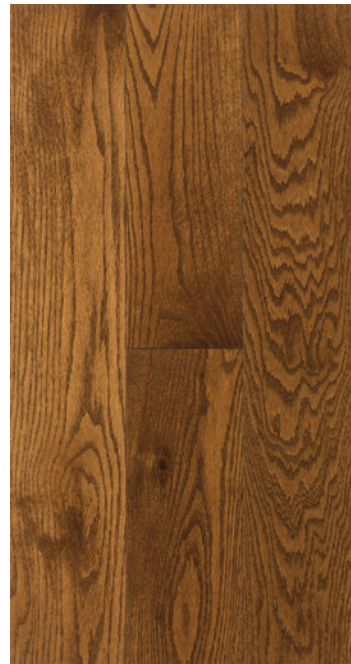
ESSENCE Chêne rouge COULEUR Java