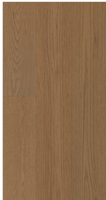
ESSENCE Chêne COULEUR Legend