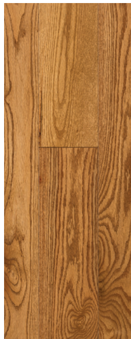
ESSENCE Chêne rouge COULEUR Toast Brown