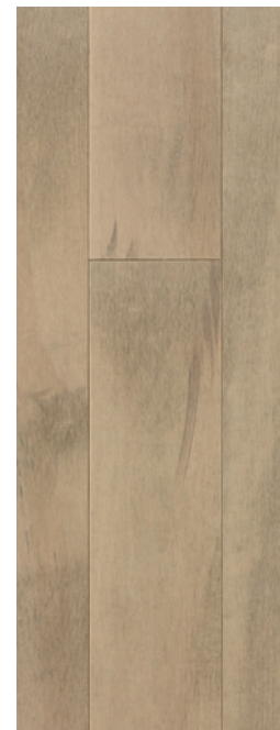
ESSENCE Érable COULEUR Shadow