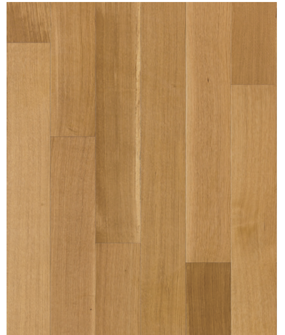
ESSENCE Chêne blanc COULEUR Naturel