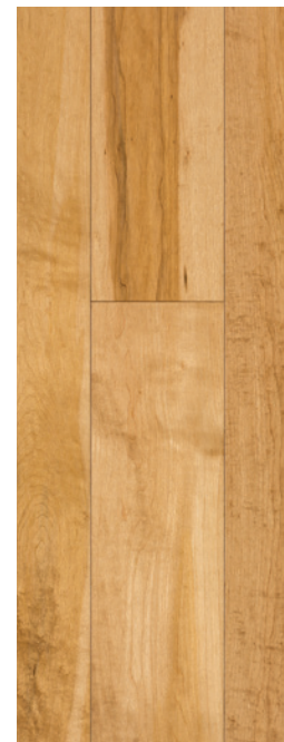
ESSENCE Érable COULEUR Toast Brown