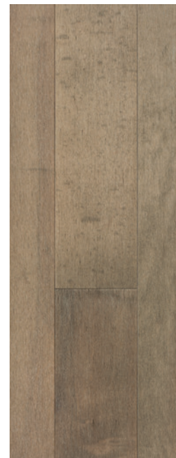
ESSENCE Érable COULEUR Stone