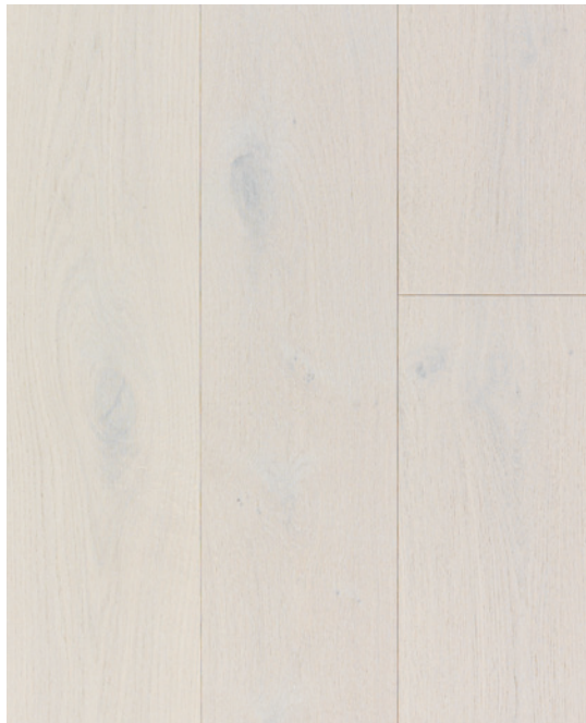
ESSENCE Chêne blanc COULEUR Orion