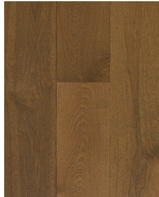
ESSENCE Chêne blanc COULEUR Solaris