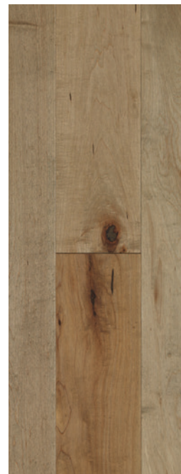
ESSENCE Érable COULEUR Trésor