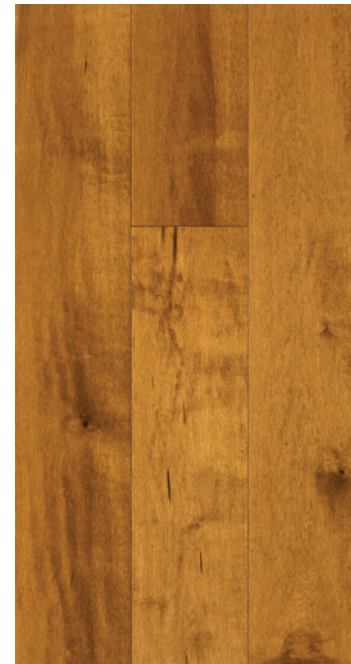
ESSENCE Érable COULEUR Gunstock