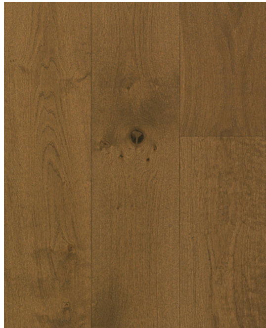
ESSENCE Chêne blanc COULEUR Equinox