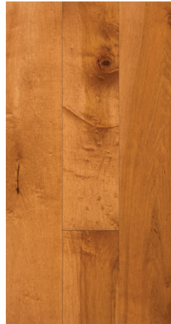
ESSENCE Érable COULEUR Amaretto