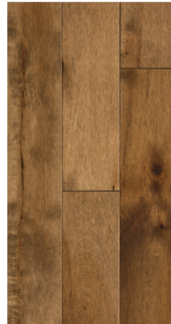
ESSENCE Érable COULEUR Acorn Brown