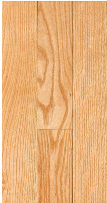
ESSENCE Chêne rouge COULEUR Naturel