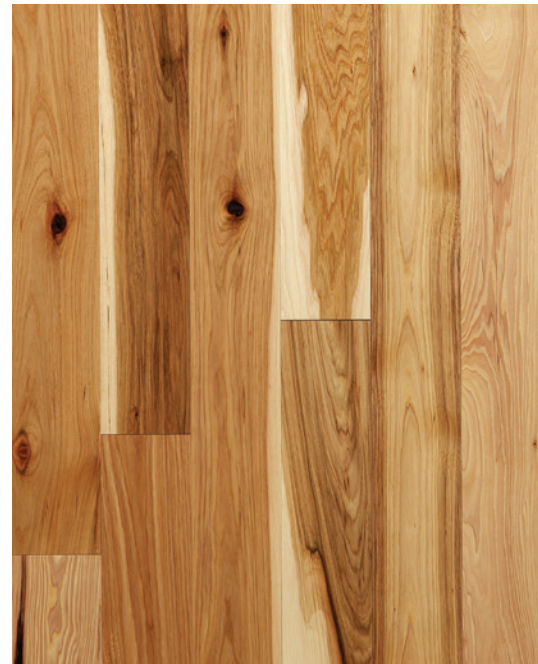
ESSENCE Hickory COULEUR Naturel