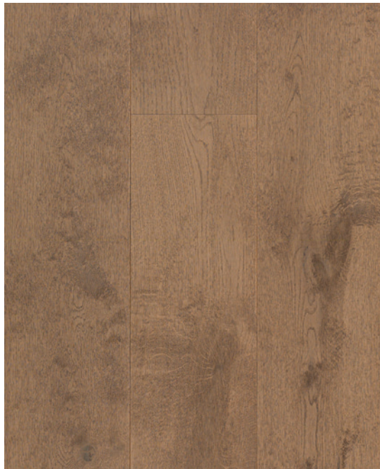
ESSENCE Chêne blanc COULEUR Nova