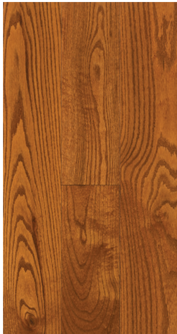
ESSENCE Chêne rouge COULEUR Amaretto