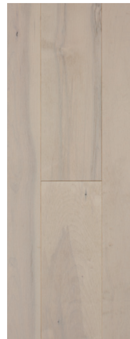
ESSENCE Érable COULEUR Ivory