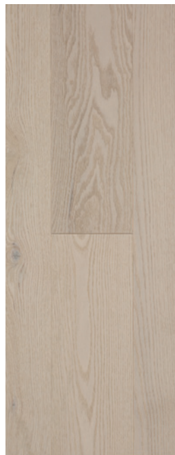
ESSENCE Chêne rouge COULEUR Ivory