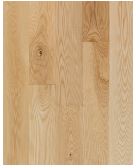
ESSENCE Frêne blanc COULEUR Naturel