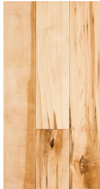
ESSENCE Érable COULEUR Naturel