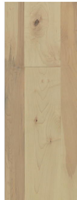
ESSENCE Érable COULEUR Madera