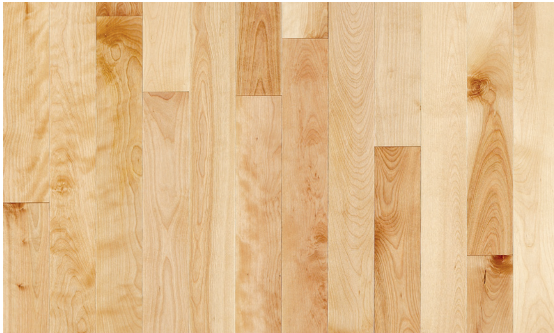
ESSENCE Merisier COULEUR Naturel