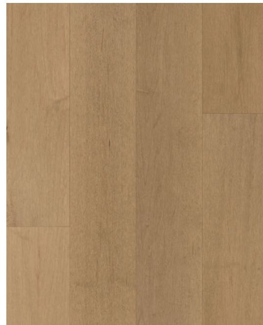
ESSENCE Érable COULEUR Idol