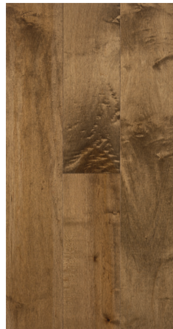
ESSENCE Érable COULEUR Arabica