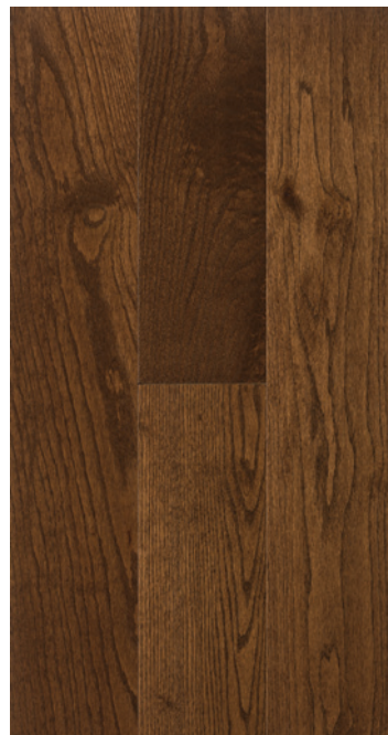
ESSENCE Chêne rouge COULEUR Medium Brown