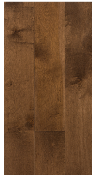
ESSENCE Érable COULEUR Medium Brown