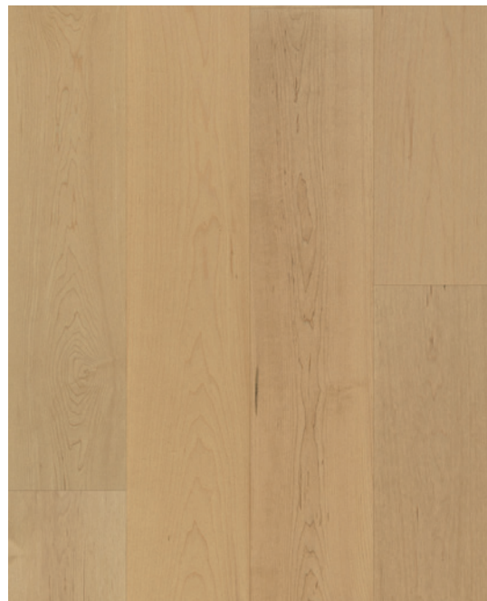
ESSENCE Érable COULEUR Anthem