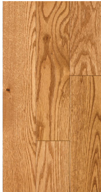
ESSENCE Chêne rouge COULEUR Moccasin