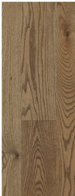
ESSENCE Chêne rouge COULEUR Trésor