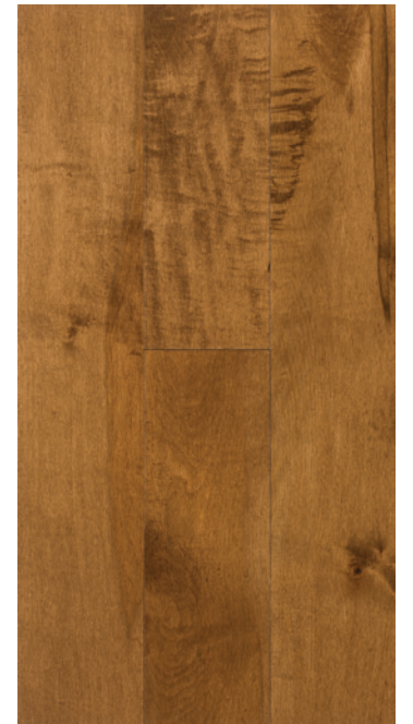
ESSENCE Érable COULEUR Java