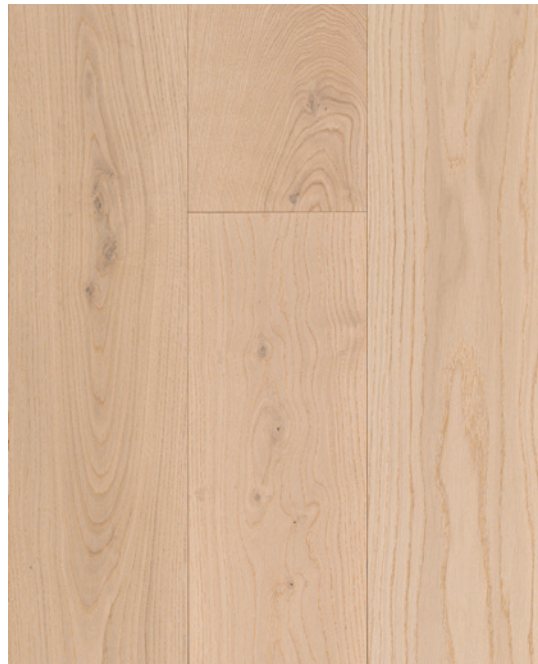
ESSENCE Chêne blanc COULEUR Celeste