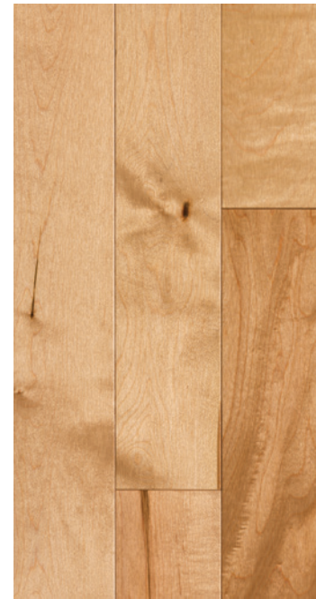
ESSENCE Érable COULEUR Moccasin