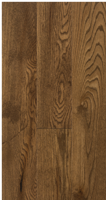
ESSENCE Chêne rouge COULEUR Arabica