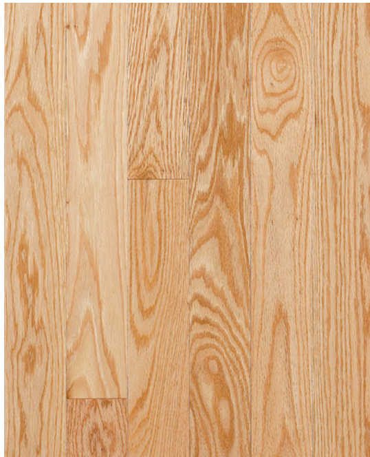
ESSENCE Chêne rouge COULEUR Naturel