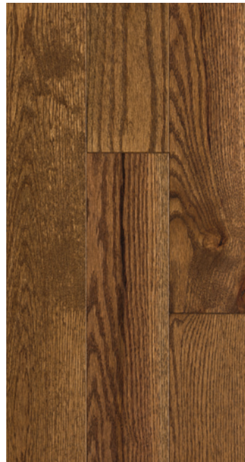
ESSENCE Chêne rouge COULEUR Acorn Brown