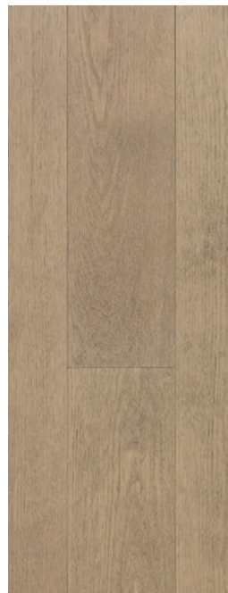
ESSENCE Chêne rouge COULEUR Shadow