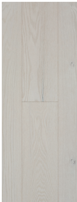
ESSENCE Chêne rouge COULEUR Mist