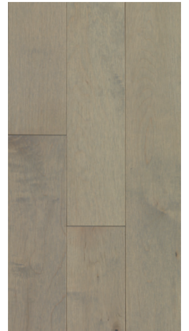
ESSENCE Érable COULEUR Brookline