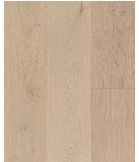
ESSENCE Chêne blanc COULEUR Lyra