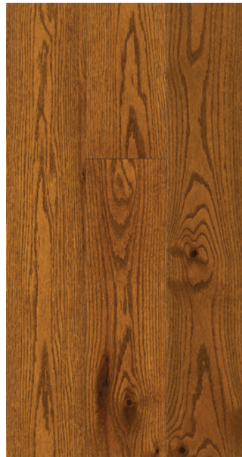
ESSENCE Chêne rouge COULEUR Gunstock