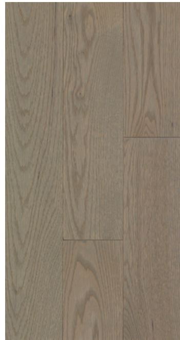
ESSENCE Chêne rouge COULEUR Brookline