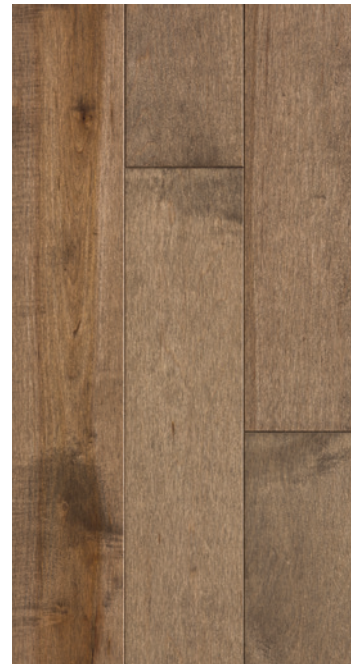
ESSENCE Érable COULEUR Concrete Grey