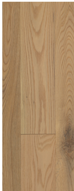
ESSENCE Chêne rouge COULEUR Madera